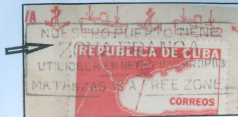
Cancelador parlante tipo II Zona Franca

Sobre de Primer Día con los valores de correo aéreo y entrega especial aérea, sin dentar, el cancelador parlante tipo II de la Zona Franca y la firma del Administrador de Correos