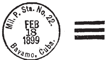
Matasellos de la Estación Militar No.22, de Bayamo / Postmark of Military Station No.22, of Bayamo.

The Military Postal Station No.22 there opened on January 1, 1899, and it closed on February 20, 1899.