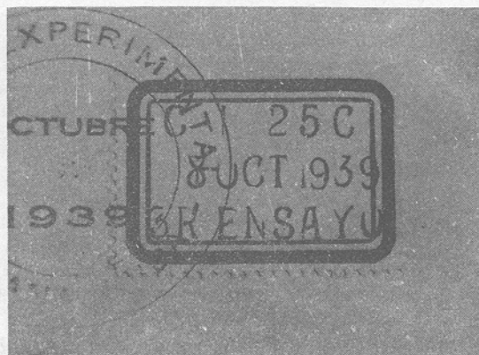
Etiqueta de borde azul utilizado el día 8 de octubre.