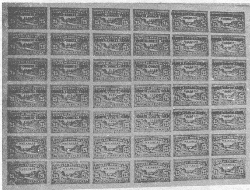
Hoja de 42 sellos del Consejo Provincial de Matanzas. Obsérvese que sólo fueron sobrecargados 30.

Aquellos sellos, de los cuales nada se sabía, resultaron enigmáticos para todos, pero aquel misterio se complicó por la existencia de algunas cubiertas procedentes del ensayo del 1.º de octubre y algunas hojas, en las que se podían ver parejas horizontales y verticales, en varias de las cuales faltaba la referida habilitación. Esto se justificaba, teniendo en cuenta que la plancha de la habilitación o sobrecarga, estaba formada por la reproducción de 3 bloques de 10 ejemplares, de manera que la plancha se componía de 30 sellos, en 5 hileras de 6. En esta forma fueron sobrecargadas las 5 hileras superiores de la hoja, quedando las dos inferiores sin sobrecargar. También se han reportado ejemplares descentrados y algunos otros detalles de menor importancia.