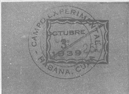
Etiqueta de borde rojo utilizado el día 3 de octubre.