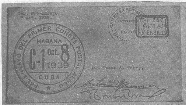
Cubierta del tercer ensayo, que tuvo lugar el día 8 de octubre, ostentando la etiqueta de borde azul.

No obstante, de tratarse de una correspondencia conmemorativa privada o simplemente filatélica si se quiere, se imponía según costumbre, un franqueo que justificara aquel correo. No era posible utilizar el sello del Cohete oficial, que aún no estaba listo y para lo cual además no se nos había autorizado. Tampoco lo estábamos para utilizar cualquier otro sello oficial en circulación, como se hizo anteriormente y en el futuro, en otros lugares, según veremos.