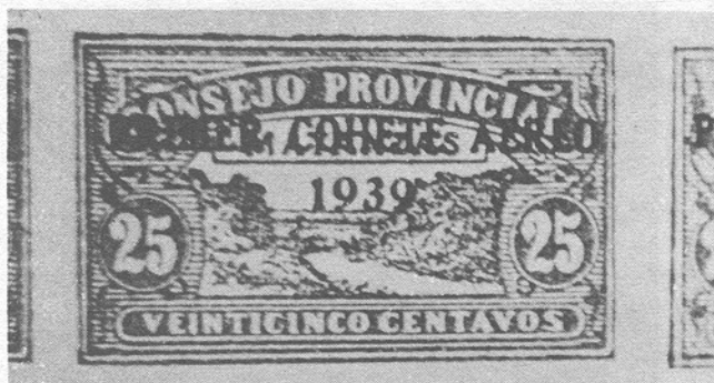
Detalle del sello del Consejo Provincial de Matanzas subrayado.