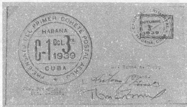
Cubierta del segundo ensayo, realizado el día 3 de octubre, franqueada con la etiqueta de borde rojo.